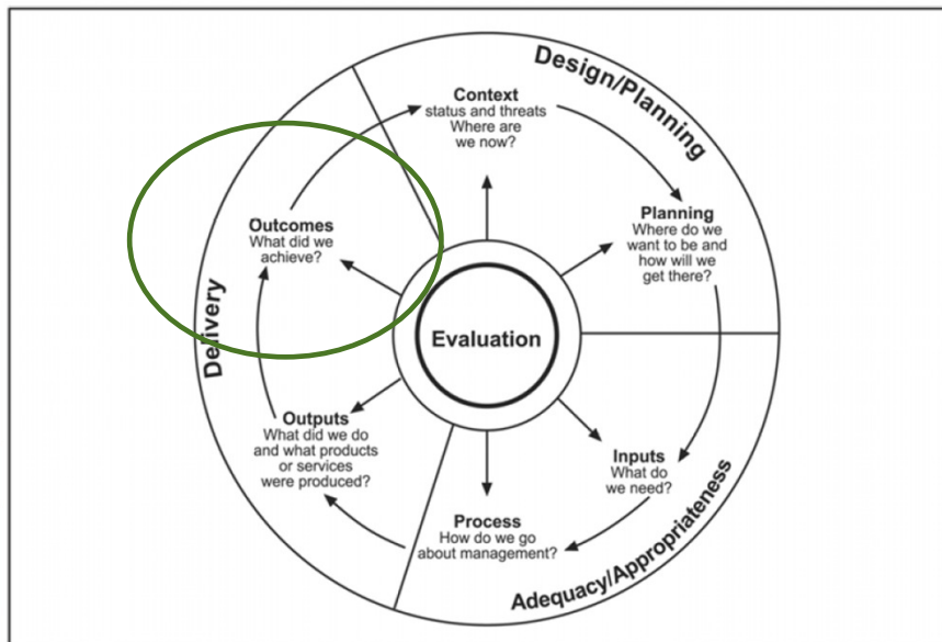
Figure 1: The protected area management cycle (Hockings et al. 2006)

... ja annab selged suunised tegevusteks.